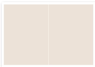
Panoramaseite B 420 x H 297 mm (+ 3 mm Beschnitt)