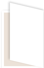
Cover Flappe B 414 x H 297 mm (+ 3 mm Beschnitt)

Alle Preise exkl. 5% Werbeabgabe und 20% USt. AGBS siehe VN-Preisliste.